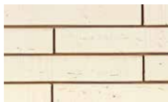
Terre blanche grenailée