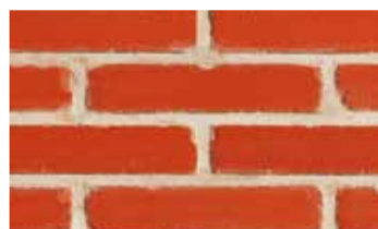
Terre rouge antique