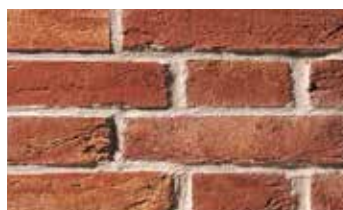
Pleine des Flandres /Vieille Ferme