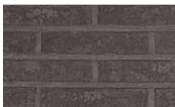
Agora noir graphite