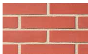
Terre rouge grenailée