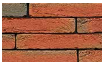
Pagrus rouge "Iluzo"