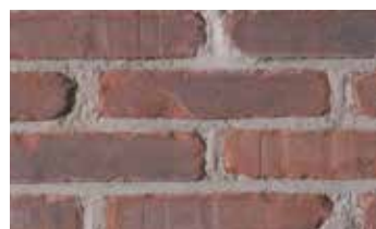
Coq de bruyère rétro