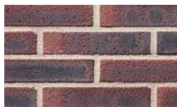
Coq de bruyère grenailée