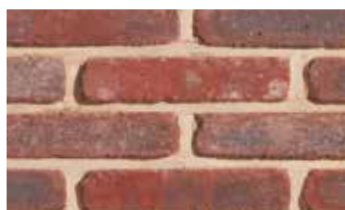
Coq de bruyère antique