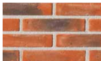
Terre de rose patinée