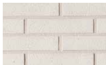
Terre blanche grenailée