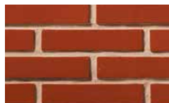
Terre rouge patinée