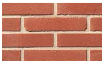
Terre rouge grenaillée