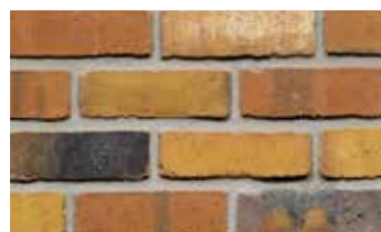
Magistrada prisma wf