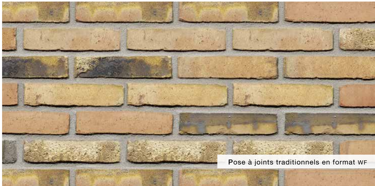
Pose à joints traditionnels en format WF