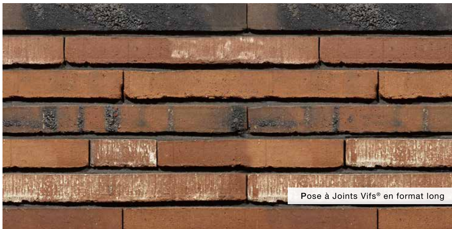
Pose à Joints Vifs® en format long