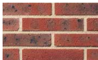
Terre de rose grenailée