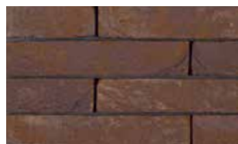
Pagus pourpre "Iluzo"