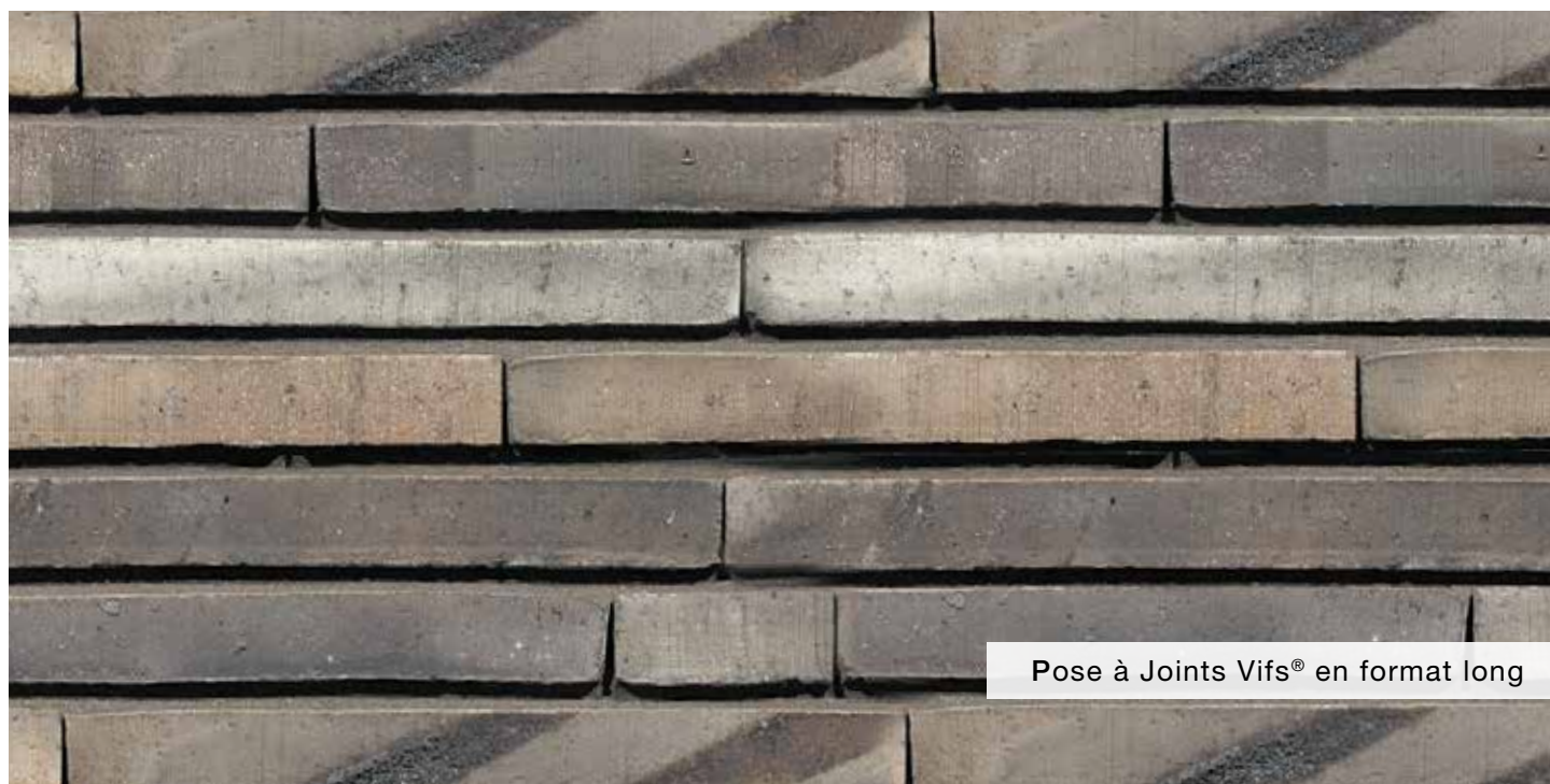
Pose à Joints Vifs® en format long