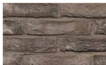
Pagus gris-noir "Iluzo"