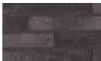
Marono extra étouffée