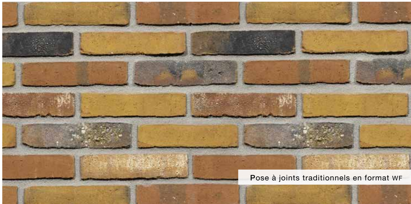
Pose à joints traditionnels en format WF