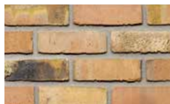
Magistrada dignita wf