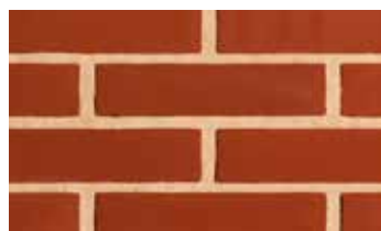
Terre carmin patinée