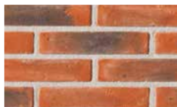
Terre de rose patinée