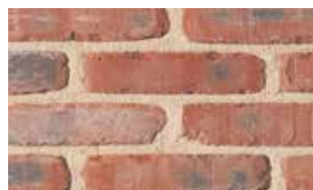
Vieux Cauchy rétro