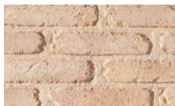
Oud Bologne "Héritage"